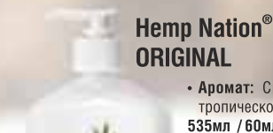
Hemp Nation® ORIGINAL

• Аромат: Свежесть тропической мечты 535мл / 60мл